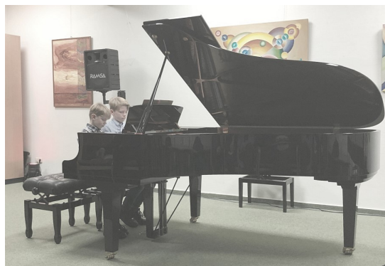
Vorspiel am Flügel im Saal der Kreismusikschule